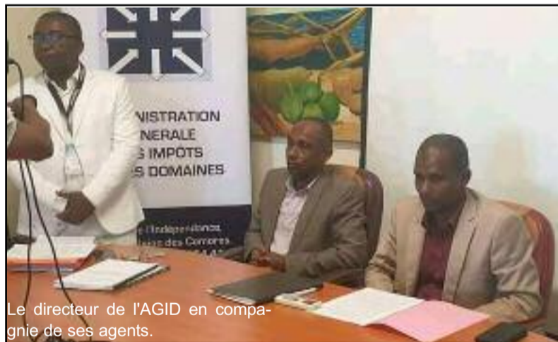
Le directeur de l'AGID en compagnie de ses agents.