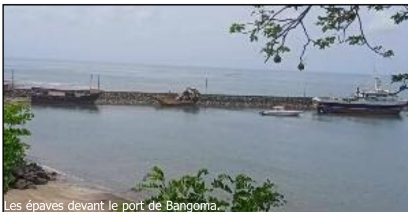
Les épaves devant le port de Bangoma.