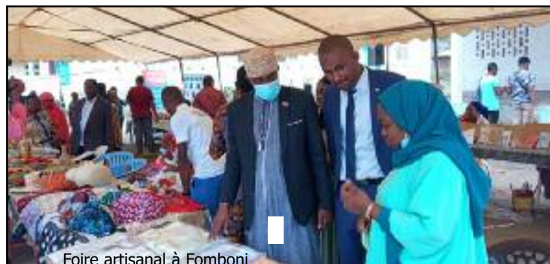
Foire artisanale à Fomboni