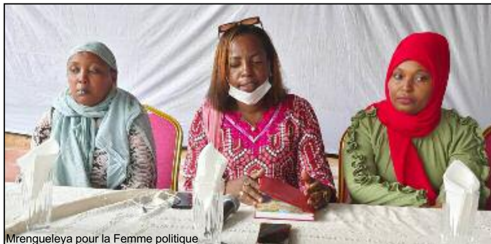
Mrengueleya pour la Femme politique