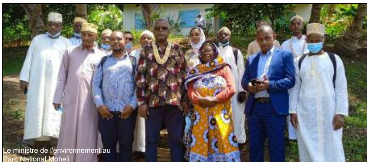
Le ministre de l'environnement au Parc National Mohéli

Plusieurs dossiers importants, selon le directeur exécutif par intérim du PNM ont été discutés lors de cette visite. Il s'agit du projet de conservation de la forêt, l'extension du territoire jugé important à protéger, le dossier du schéma d'aménagement du territoire dont le PNM a un principal rôle à jouer puisqu'il a le leadership de ce domaine à Mohéli et dans d'autres. « La visite du ministre de l'aménagement au parc national de Mohéli nous tient à cœur car c'est très rare de voir notre