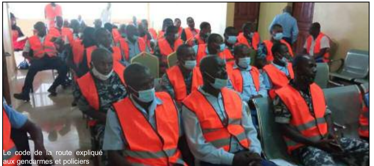
Le code de la route expliqué aux gendarmes et policiers

Selon les statistiques faites en 2020 par la gendarmerie nationale, 76% des accidents de la route ont eu lieu dans des agglomérations. Les adolescents et adultes de 15 à