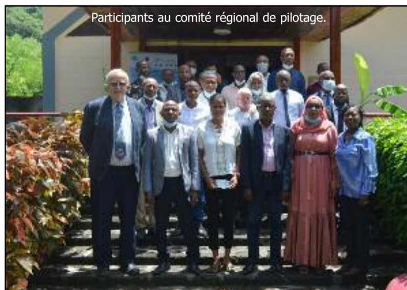
Participants au comité régional de pilotage.

africaine comme le nouveau pilier de la renaissance africaine. L'économie bleue peut jouer un rôle majeur dans la transformation structurelle des pays africains, le progrès économique durable et le développement social.