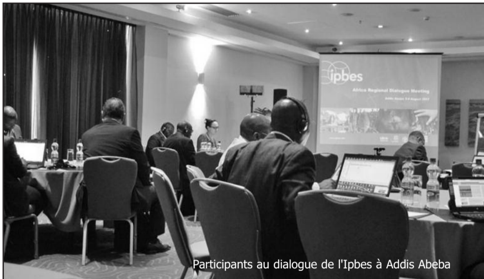
Participants au dialogue de l'Ipbes à Addis Abeba

Pour rappel, l'Ipbes est une véritable interface sur les questions de biodiversité et de la politique. Elle a été créée en avril 2012 après sept ans de négociations internationales. Son objectif essentiel est de fournir aux Etats, au secteur privé et à la société civile des évaluations scientifiquement crédibles, indépendantes et actualisées des connaissances disponibles afin de prendre des décisions informées, au niveau