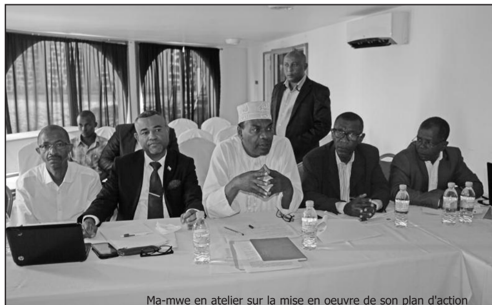
Ma-mwe en atelier sur la mise en oeuvre de son plan d'action