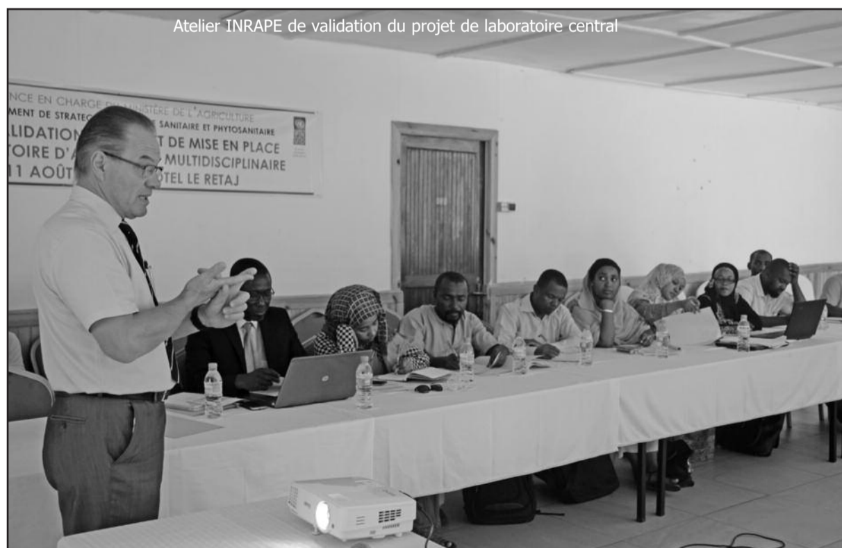
Atelier INRAPE de validation du projet de laboratoire central