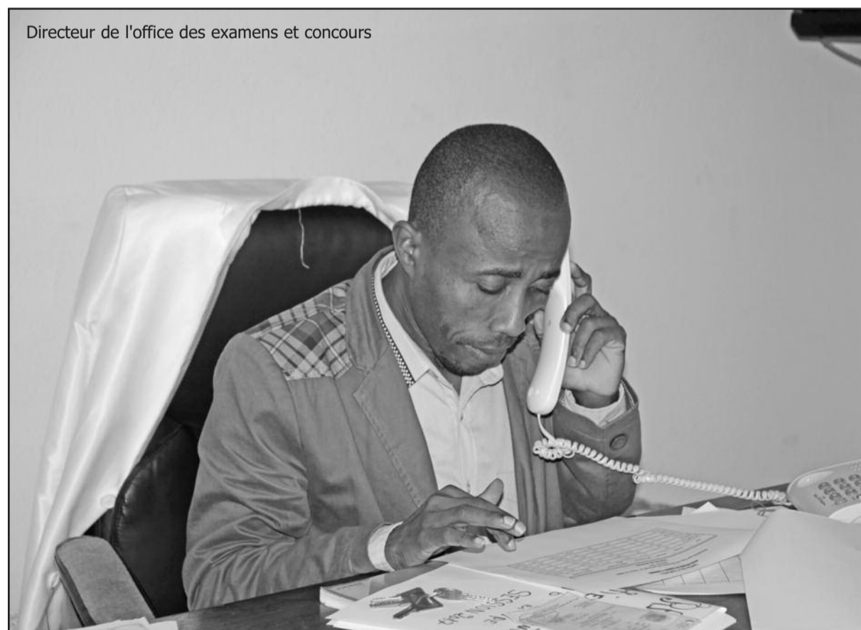
Directeur de l'office des examens et concours