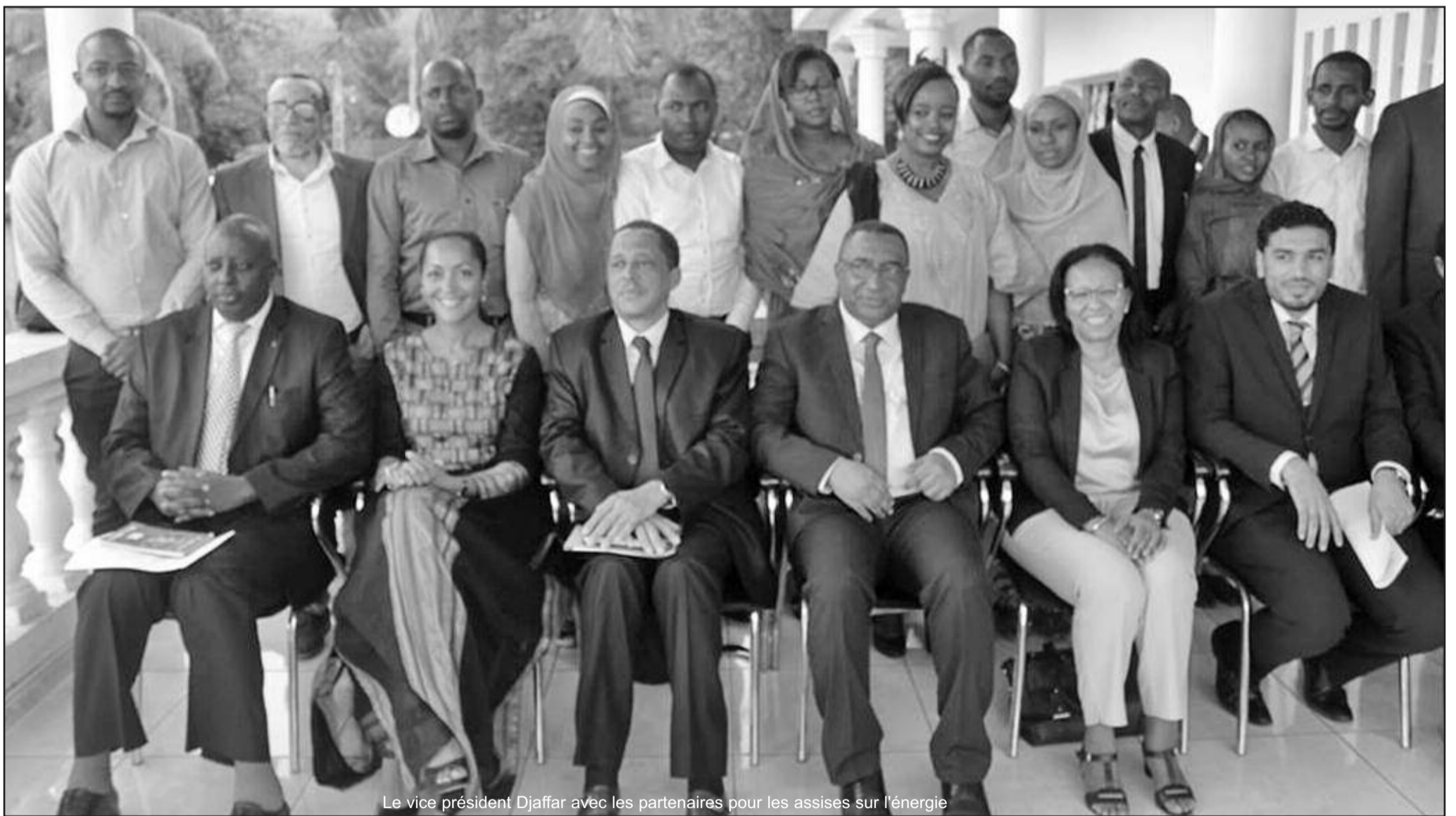
Le vice président Djaffar avec les partenaires pour les assises sur l'énergie