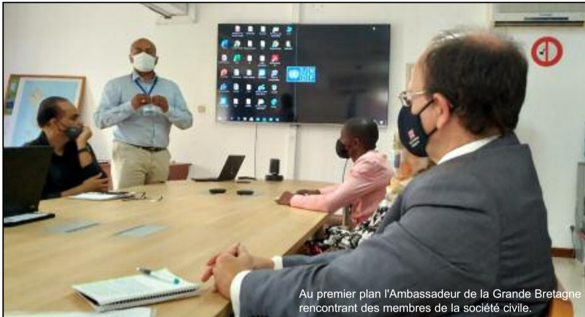
Au premier plan l'Ambassadeur de la Grande Bretagne rencontrant des membres de la société civile.

Pour la première fois, le Royaume-Uni accueillera la 26ème Conférence des Parties des Nations Unies sur le changement climatique (COP26) à Glasgow du 1er au 12 novembre 2021. Cette conférence sur le climat sera le plus grand sommet international que le Royaume-Uni ait jamais organisé en rassemblant des chefs d'État, des experts du climat, des jeunes, la société civile, des syndicats, des groupes confessionnels et des peuples autochtones pour convenir d'une action coordonnée pour lutter contre le changement climatique.