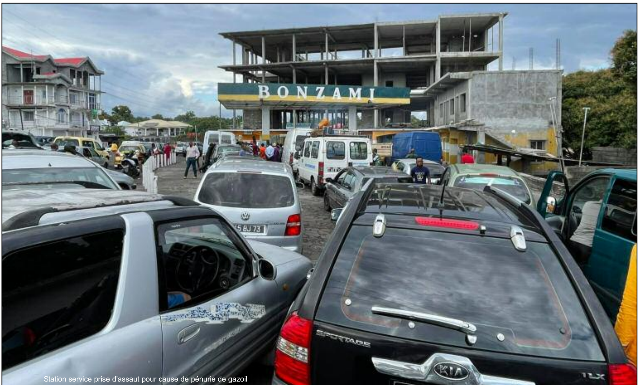
Station service prise d'assaut pour cause de pénurie de gasoil