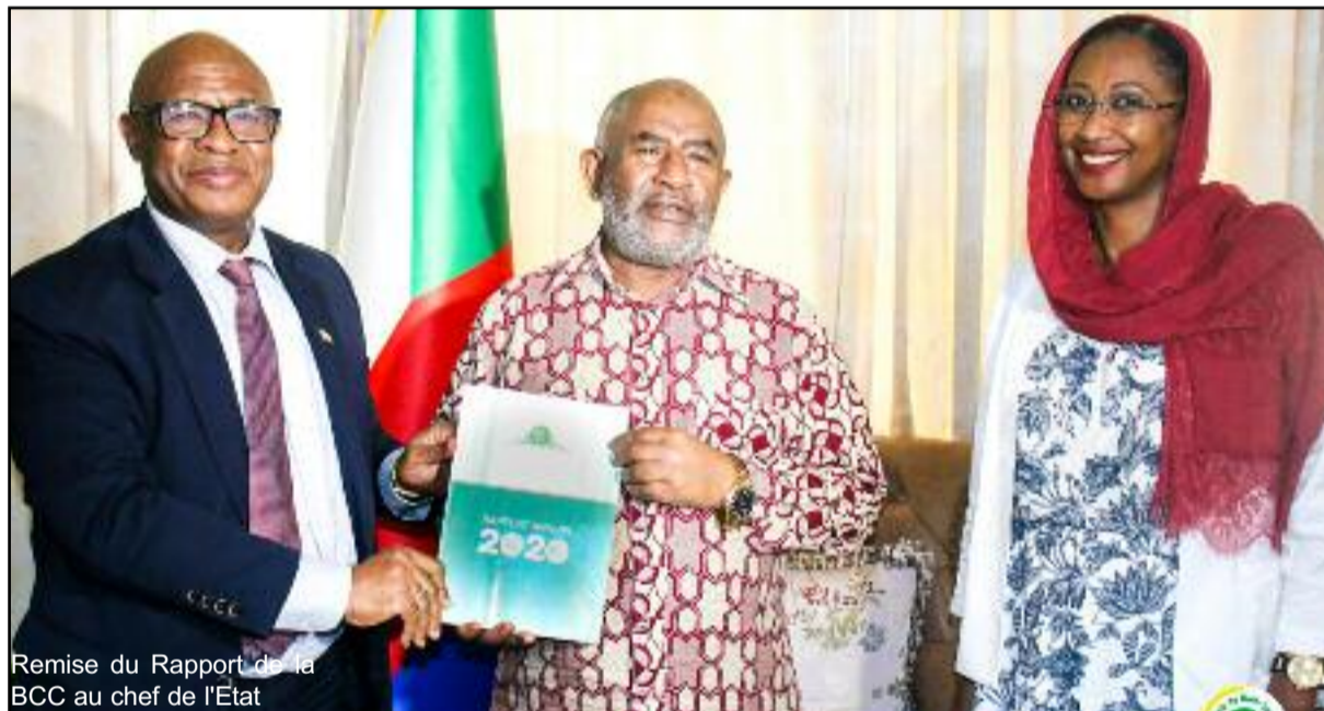
Remise du Rapport de la BCC au chef de l'Etat

En effet, les entrées de devises ont fortement augmenté passant de 80,3 milliards FC en 2019 à 106,3 milliards FC en 2020, soit une augmentation de 32,4%. Cette hausse s'explique par le comportement de solidarité familiale qui a toujours