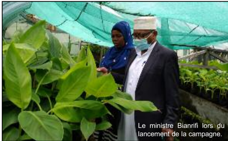
Le ministre Bianrifi lors du lancement de la campagne.

Dans son allocution, le ministre s'est félicité du processus en cours qui va permettre aux Centres Ruraux de Développement Économique (Crde) de Diboini à Ngazidja, de Pomoni à Ndzuwani et