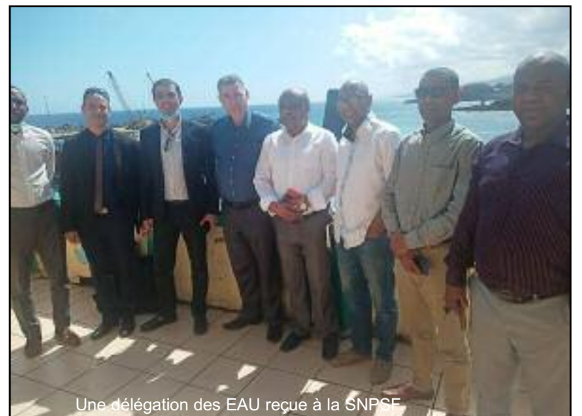
Une délégation des EAU reçue à la SNPSF