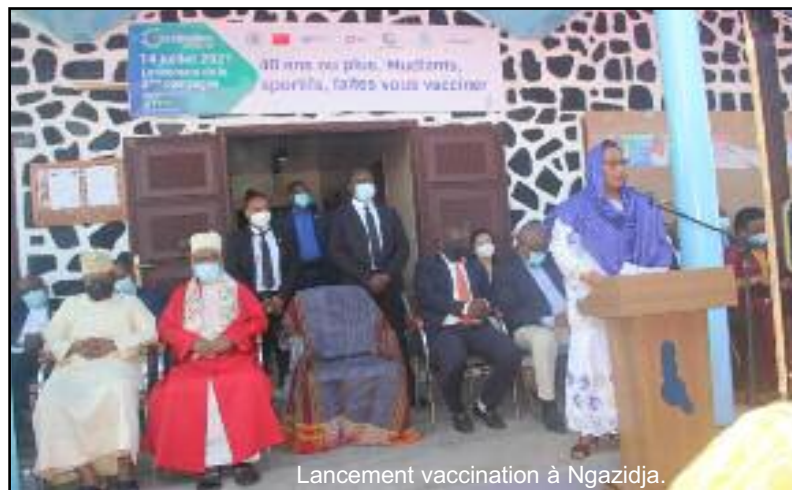
Lancement vaccination à Ngazidja.

Et pour y faire face, deux types de stratégies sont mises en place à savoir la stratégie fixe et la stratégie avancée à travers 39 sites de vaccination, dont 24 fixes et 15 mobiles. Plusieurs activités de pré-campagne ont eu lieu notamment la formation de l'ensemble du personnel (superviseurs, vaccinateurs, pointeurs, mobilisateur, agents de la santé communautaire et même les incinérateurs). Des rencontres avec les autorités locales des 7 districts sanitaires de Ngazidja ont eu lieu afin de les sensibiliser sur la question.