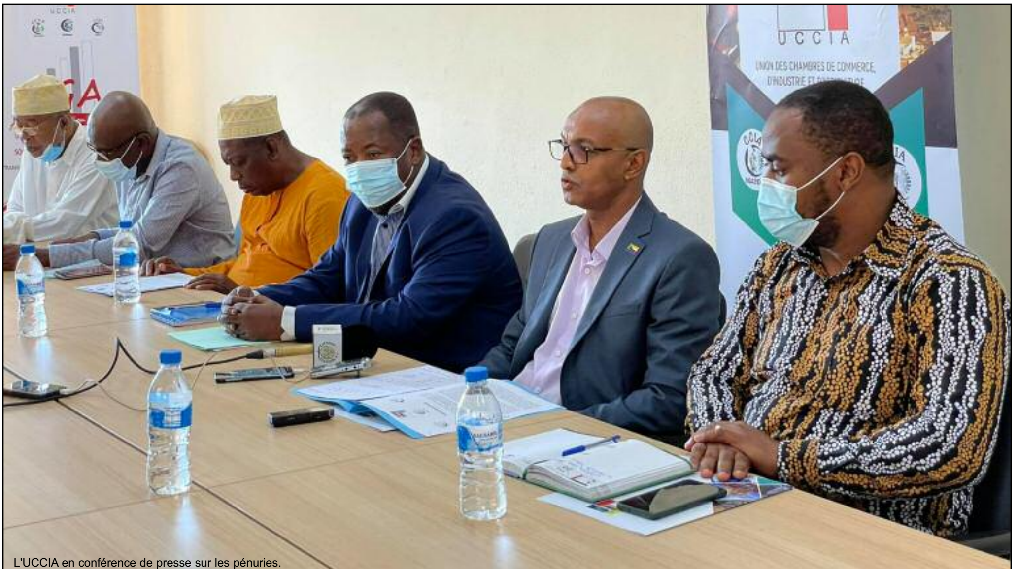
L'UCCIA en conférence de presse sur les pénuries.

Nous informons notre aimable clientèle de la reprise des vols EWA AIR Moroni-Mayotte-Moroni tous les vendredis et dimanche à compter du 9 juillet avec des correspondances pour la Réunion et Paris.