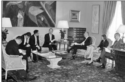
Le président portugais Marcelo Rebelo de Sousa a accordé une interview exclusive au Quotidien du Peuple, le 31 mai à Lisbonne.