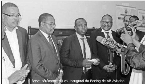
Breve cérémonie du vol inaugural du Boeing de AB Aviation

« Et surtout la diaspora comorienne. Cette nouvelle ligne offerte à cette diaspora qui rencontre des ennuis en plein voyage pour se rendre à Moroni », renchérit la communication qui promet qu'a-