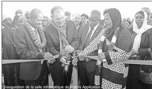
Inauguration de la salle informatique de Moroni Application

15 ordinateurs, une imprimante, un réseau, un projecteur, une sécurité électrique sont entre autres le matériel que Moroni Terminal a doté à l'école Application. « Notre souhait est que ce nouvel outil puisse assister tout d'abord les professeurs dans leur noble et difficile mission d'enseignement, mais qu'il