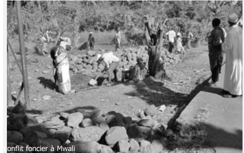
Conflit foncier à Mwali

Il ne se passe pas une semaine à Mwali sans qu'il n'y ait un dossier sur un conflit foncier à la gendarmerie, à la police ou au tribunal. Cette semaine ce sont les habitants des quartiers Islamique, Colas et Minadzin qui s'opposent à une propriété privée, sur un terrain situé juste à coté de la rivière Msoutrouni.