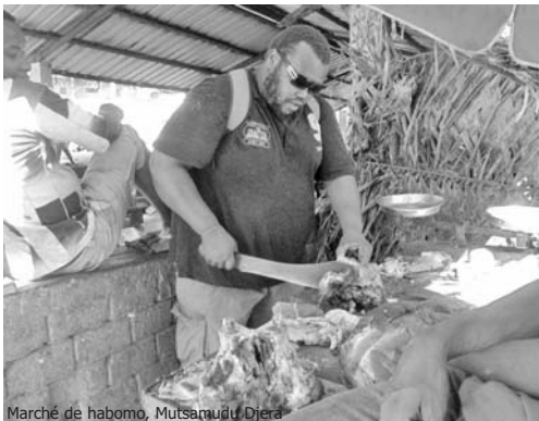
Marché de habomo, Mutsamudu, Djera