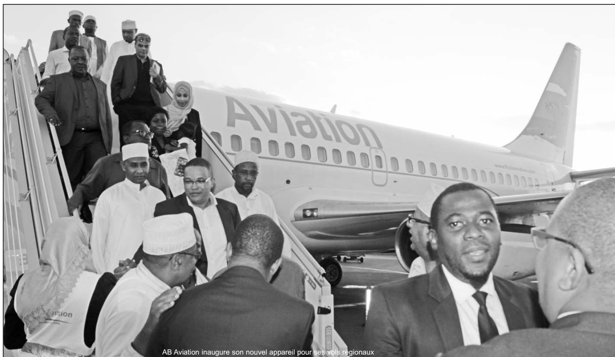
AB Aviation inaugure son nouvel appareil pour ses vols régionaux